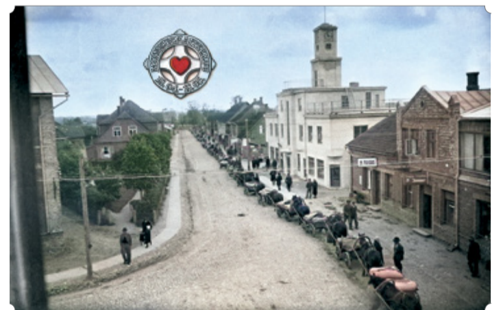
Eesti Muinsuskaitse Selts ja Antsla Vallavalitsus kutsuvad osa võtma ajaloo päevast